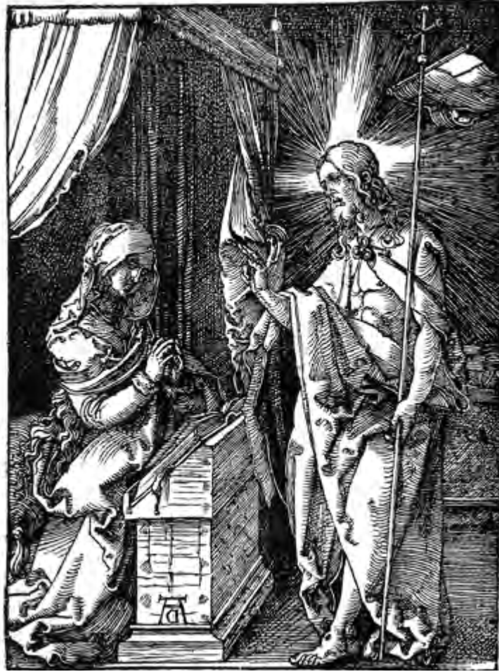
ALBRECHT DÜRER Christ i comparis a Marie